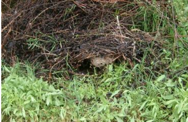
Abbildung 1: Vornest im Frühling http://www.hornissenschutz.ch/vespa-velutina-nth.htm

In den Wintermonaten sind die verlassenen grossen Nester mit seitlichem Einflugloch dank der Laubfreiheit gut in den Baumkronen zu erkennen.