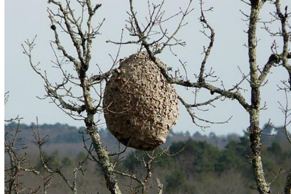
Abbildung 2: Nest in Baumkrone

Bitte melden Sie verdächtige Vor- und Hauptnester und Insekten (mit Bild und Koordinaten) an die Meldestelle für verdächtige Insekten und Nester: