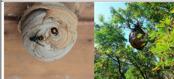
© Laurino, D.; Lioy, S.; Carisio, L.; Manino, A.; Porporato, M. (2020). Vespa velutina : An Alien Driver of Honey Bee Colony Losses. Diversity 2020, 12, 5. (Online-Link)